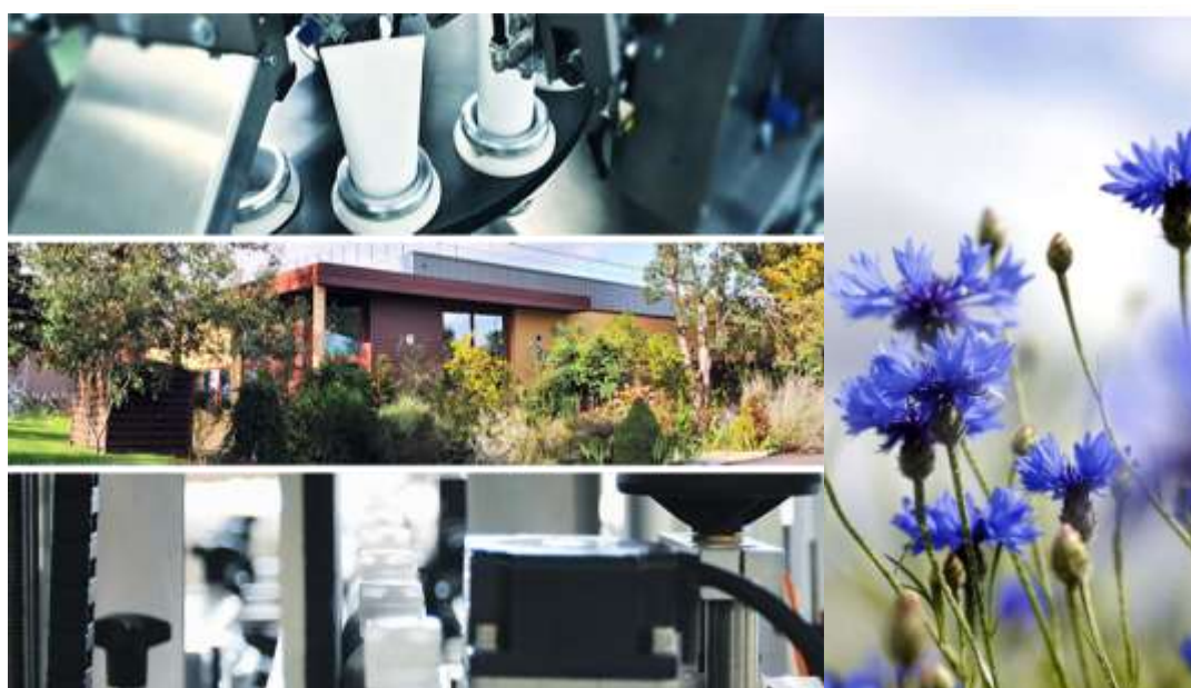
2024 : Prévost Laboratory Concept ouvre ses portes à Cosmed

https://fabrication-cosmetique-faconnage.fr