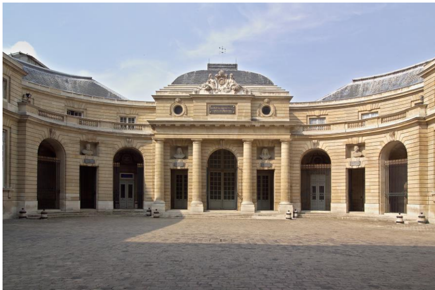
La Monnaie de Paris La dernière usine encore en activité dans Paris intramuros